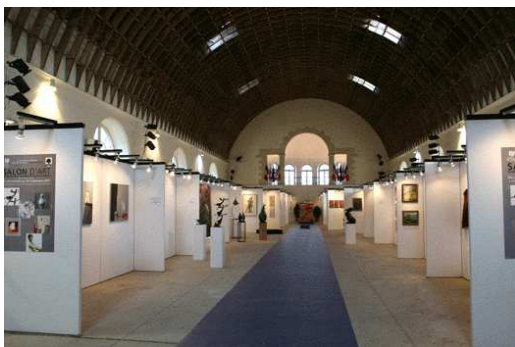
Manège Royal de Saint-Germain-en-Laye Lors de l'exposition Art Fair—novembre 2007 www.saintgermainenlaye.fr

L'attitude des artistes et celle des visiteurs de cette exposition contribueront à ce que chacun élabore une réponse signifiante au questionnement posé par son existence et permettront d'engager un dialogue avec d'autres.