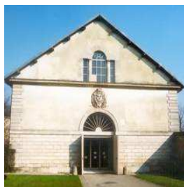
Manège Royal de Saint-Germain-en-Laye www.ot-saintgermainenlaye.fr